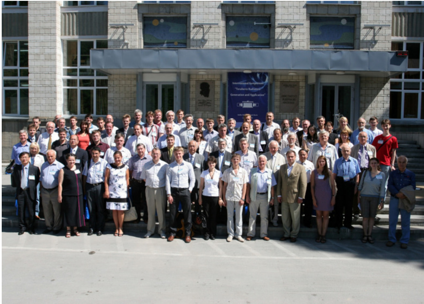
Групповое фото участников симпозиума