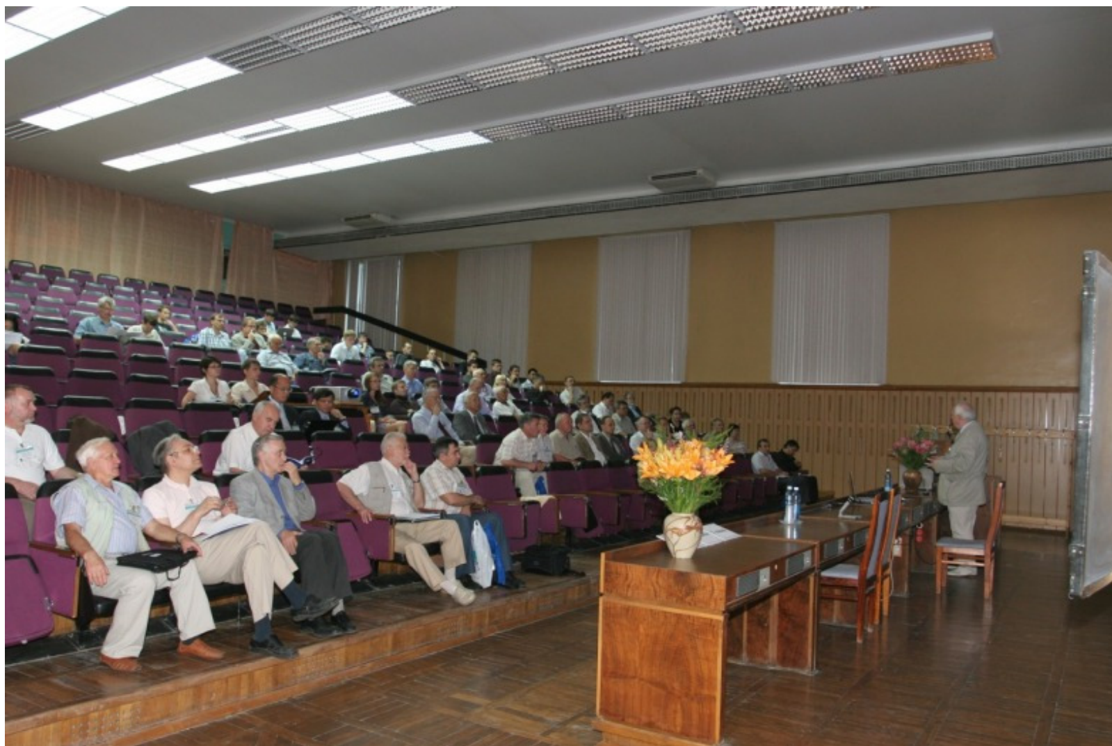
Академик Г. Н. Кулипанов открывает симпозиум