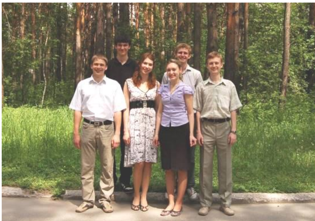
Группа выпускников кафедры физики полупроводников после защиты дипломов A group of graduates of the Department of Semiconductor Physics after defending their diplomas

Подготовка специалистов на кафедре реализуется известными российскими научными школами, получившими мировое признание. Высокий уровень подготовки специалистов на кафедре физики полупроводников обеспечивается оптимальным выбором обновляемых спецкурсов, правильным сочетанием экспериментальных и теоретических методов с широким использованием компьютерной техники современного научного и технологического оборудования, учебной литературы.