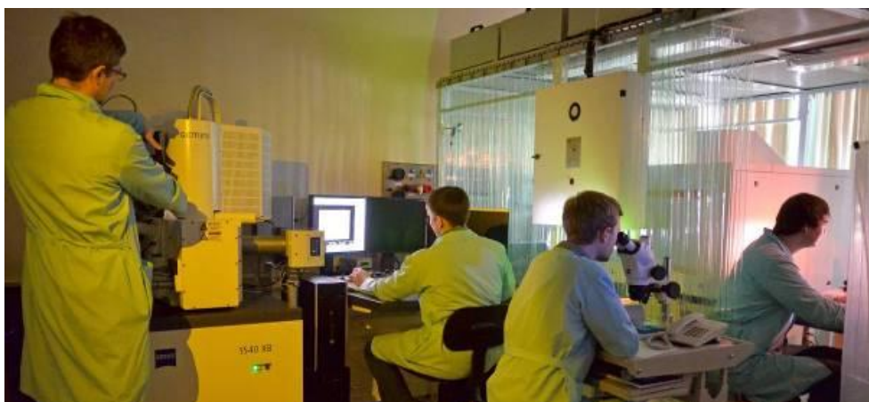
Научная работа студентов кафедры физики полупроводников Research work of students at the Department of Semiconductor Physics

Институт занимает ведущие позиции в области физики полупроводников, физики конденсированного состояния, физики и технологии низкоразмерных систем, опто-, нано- и акустоэлектроники, сенсорики, однофотоники и одноэлектроники, квантовой электроники, спинтроники. Основные фундаментальные достижения Института связаны с исследованием атомных процессов и электронных явлений на поверхности полупроводников и границах раздела полупроводниковых структур, квантовых эффектов в структурах пониженной размерности, в том числе в сверхрешетках и гетероструктурах с квантовыми ямами [1; 2]. Важными представляются работы Института по разработке элементной базы перспективной электронной техники и нового поколения устройств нано- и оптоэлектроники, основанных на использовании низкоразмерных структур, в которых происходит переход к нанометровым масштабам, и, как следствие, определяющую роль начинает играть квантово-механическая природа квазичастиц в твердом теле.